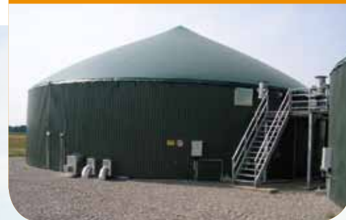
▼ Untié de méthanisation