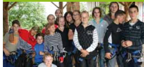
▲ Camp jeunes