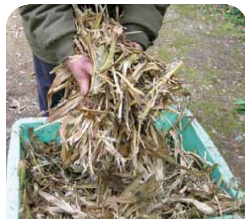
▲ Récolte de la paille de maïs

La CCME envisage la création d'un bâtiment collectif d'une surface de 2000m 2 destiné à la création d'ateliers et de bureaux. Des services, tels que le secrétariat ou la reprographie, pourront être partagés entre les futures entreprises présentes sur le site.