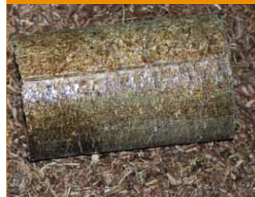
▲ Fabrication de « briquettes »