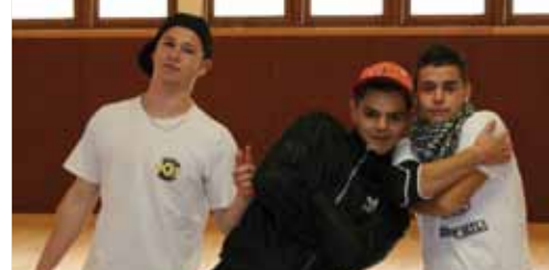
▲ Section danse Hip-Hop