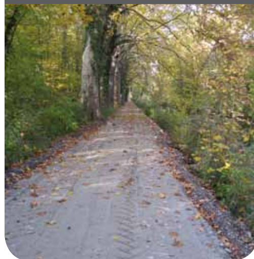
▼ Itinéraire cyclable le long du canal du Rhône au Rhin