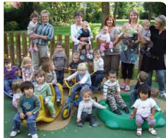
▲ « Le jardin des Loupiots »

Le Relais d'Assistants Maternelles a beaucoup évolué ces dernières années. Il gère aujourd'hui 85 assistantes maternelles, contre 55 à sa création, en juin 2000. Cette progression est en partie liée à la pro-