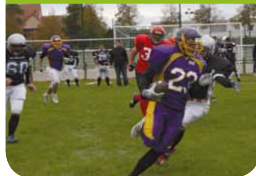
▼ RAI'volution sportive