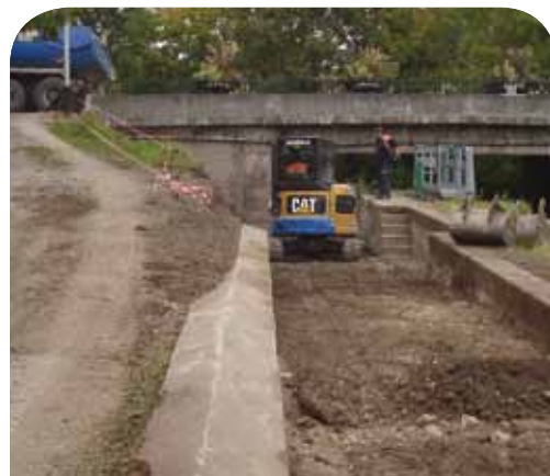
▲ Travaux à l'écluse

Sans conteste, c'est une avancée significative dans le domaine des déplacements doux et celui du développement touristique de notre secteur.