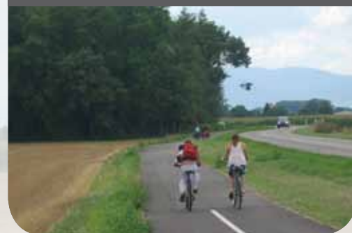
Voie verte Marckolsheim / Elsenheim

Dans un second temps, la mise aux normes (sur le modèle des parcs urbains) de l'ensemble des arbres (près de 600 sur le linéaire des 25 km). Coûts prévisionnels de ces opérations : de 100 000 à 250 000 €.