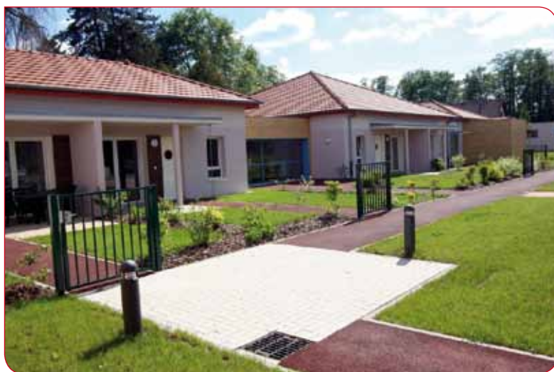
◀ Exemple de MARPA de la Doller à SENTHEIM (Haut-Rhin)

Dans ce contexte, une étude a été réalisée par la ville de Marckolsheim et la Communauté de Communes de manière à établir un diagnostic quant aux besoins et aux attentes de la population.