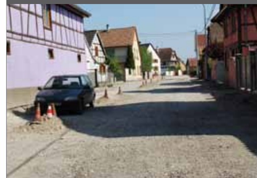
▲ Ohnenheim : Rue du Moulin