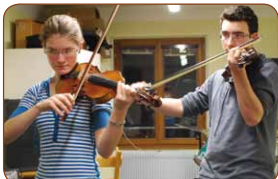
◀ Nouvelle compétence de la CCME depuis janvier : l'Ecole de Musique Intercommunale de Marckolsheim et Environs.