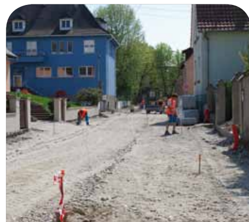
▲ Elsenheim : Rue de l'Ecole

La fin de ces travaux est prévue en juillet 2011.