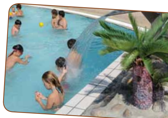
▲ Piscine Aquaried : une subvention légèrement en hausse pour mieux répondre aux attentes des usagers.